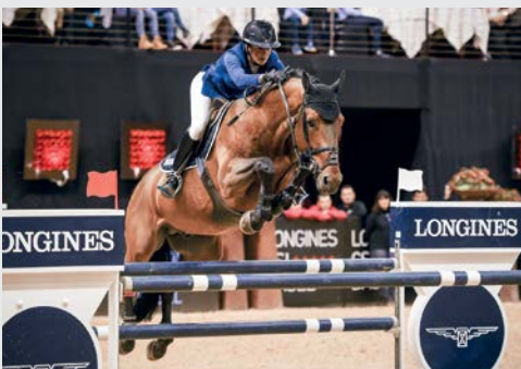
Vagabond de la Pomme Vigo D'Arsouilles/Nabab de Reve