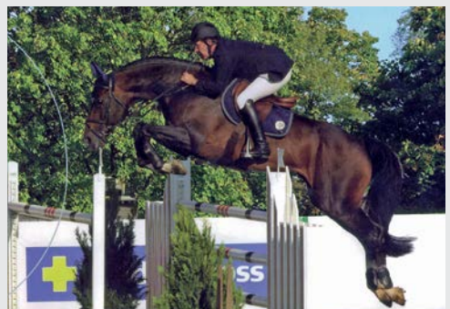
Toulon v. Heartbreaker/Jokinal de Bornival