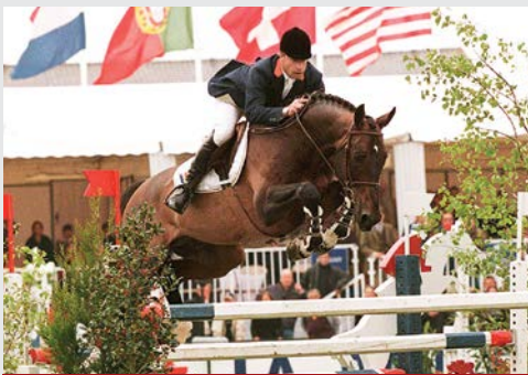
Kannan v. Voltaire/Nimmerdor